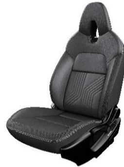
Tekna Mustat synteettiset