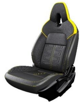
N-Sport Musta, osittain kohokuvioitu nahka- ja osittain keltainen