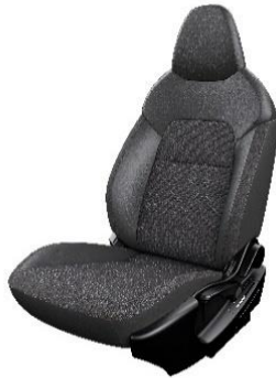
N-Connecta Musta kohokuvioitu