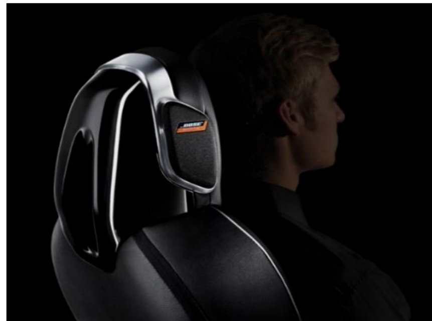
Bose® Personal audio