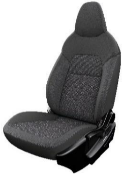
Acenta Musta tekstiiliverhoilu