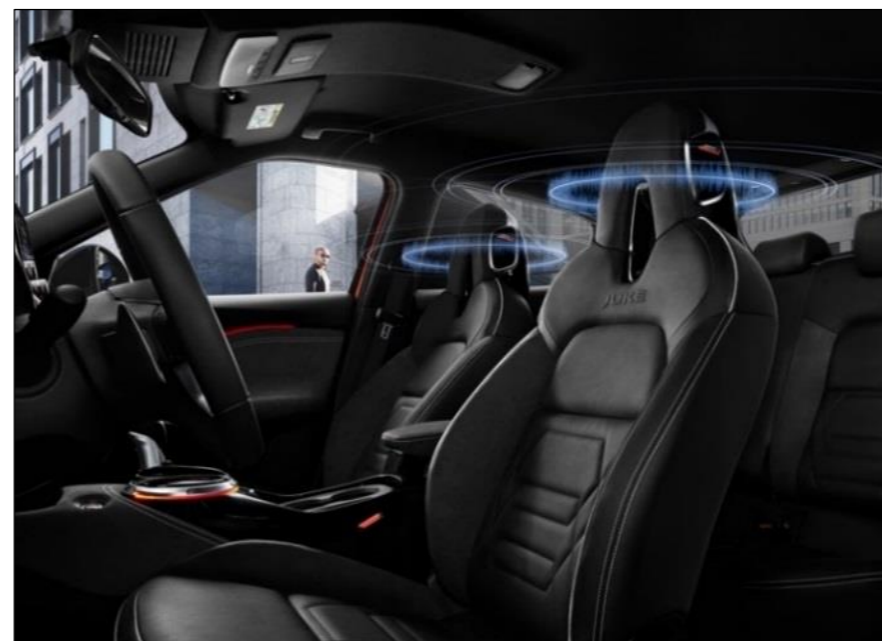
Bose® Personal audio 360