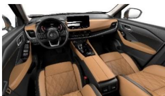
Tekna & Tekna+ Lisävaruste Tekna(e-POWER- ja e-4ORCE-mallit)