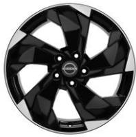
Acenta & N-Connecta

18" timanttileikatut kevytmetallivanteet (235/60 R18)