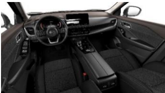
Acenta & N-Connecta Musta - tekstiili