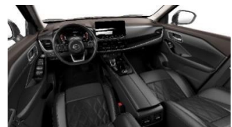
Tekna & Tekna+ Musta - premiumnahka