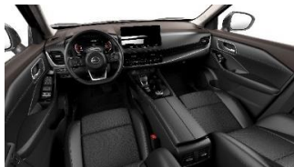
N-Trek Musta - Keinonahka