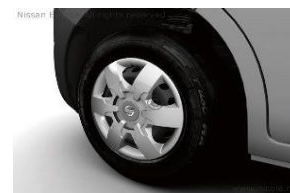
Täyskapselit 16" teräsvanteilla