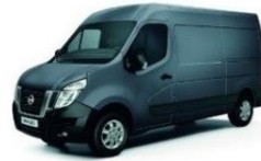
Blue Grey (J47)