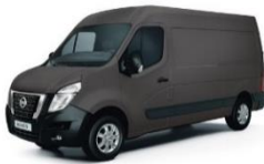
Urban Grey (GRU)