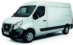
Mineral White (QNG)