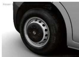
Pienet pölykapselit 16" teräsvanteilla