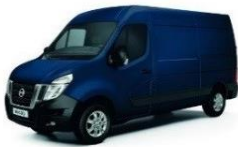
Volga Blue (VBL)