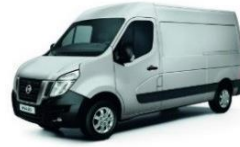
Star Grey (KNH)